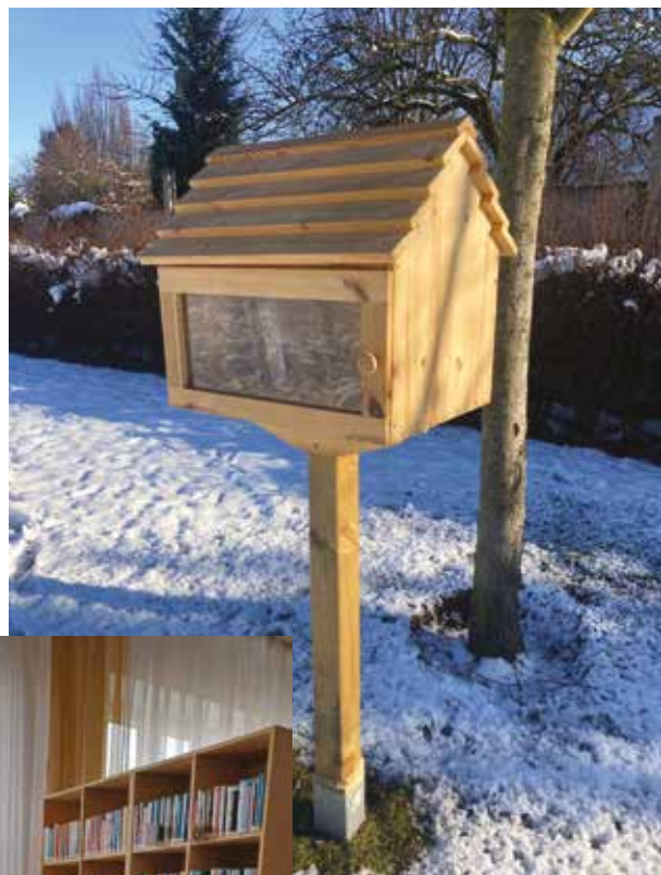
Knihobudka park v ul. Tichá