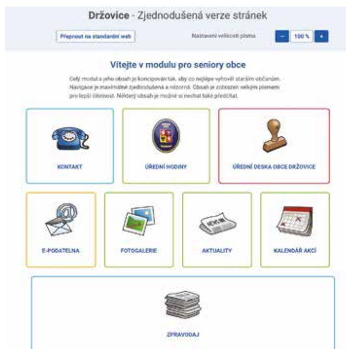
Zjednodušená verze stránek.

Dne 20. 12. 2021 byla schválena zpráva o uplatňování územního plánu obce Držovice. Aktualizovaný územní plán je nyní v rukou architekta, který zpracovává zadanou dokumentaci. Jakmile bude dokumentace připravena, bude se jí zabývat zastupitelstvo obce.