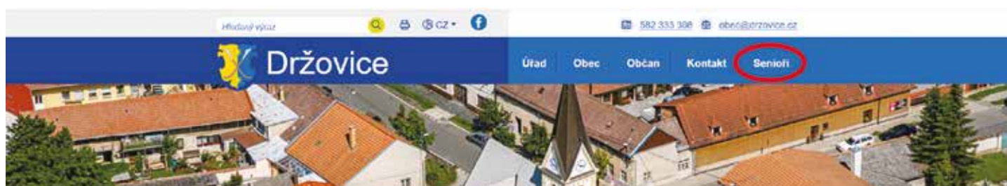
Standardní zobrazení webu. Záložka senioři.

Na webu obce Držovice přibyla nová záložka Senioři, která vám umožní snadnější navigaci na našich stránkách. Po rozkliknutí záložky Senioři, se webové stránky přepnou do zjednodušené verze, která vám umožní jednoduchou navigaci nebo např. nastavení velikosti písma.